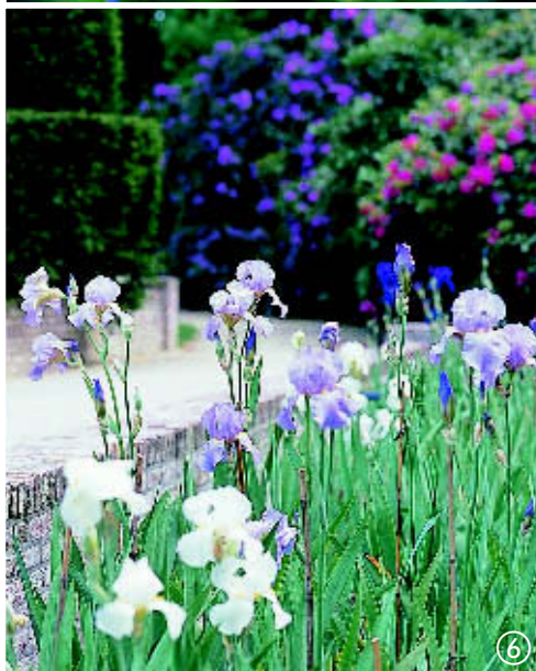
De tuin van Janine van den Ende is een kleurrijk geheel. De rododendron (foto 2) en irissen (foto 6) zijn echte blikvangers. Verder is de romantische orangerie (foto 4) een absolute sfeermaker in de tuin.